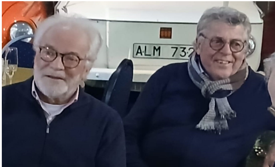
Gaande en komende man